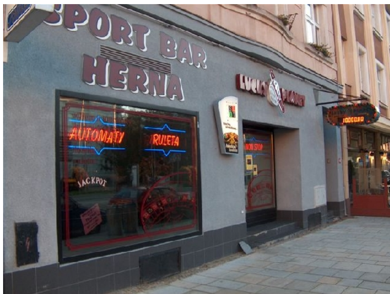
Foto 3 : Třída 9. Května - jako příklad samosprávy modernizovat parter a odklon vybavenosti směrem k nižší přidané hodnotě

Nelze si nepovšimnou historických náměstí v českých městech tam, kde se výstavbou obchodních řetězců šetří a naopak tam, kde jich je v okolí řada.